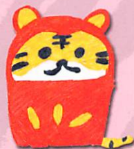
矢野早耶香さん作

障害のある人に、2022年の干支「寅（とら）」を思い思いの形で自由に描いてもらい、その中から選ばれた作品が、日本茶専門店『茶論 Salon du JAPON MAEDA』のパッケージになりました！